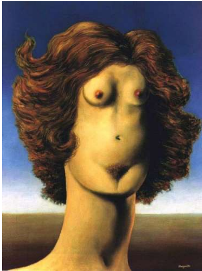
Magritte : Femme 1952