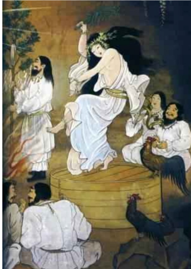
Divinité japonaise : Kami Ame No Uzume