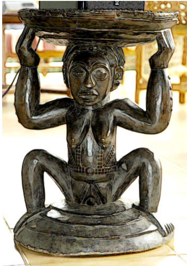
Statuette du Congo