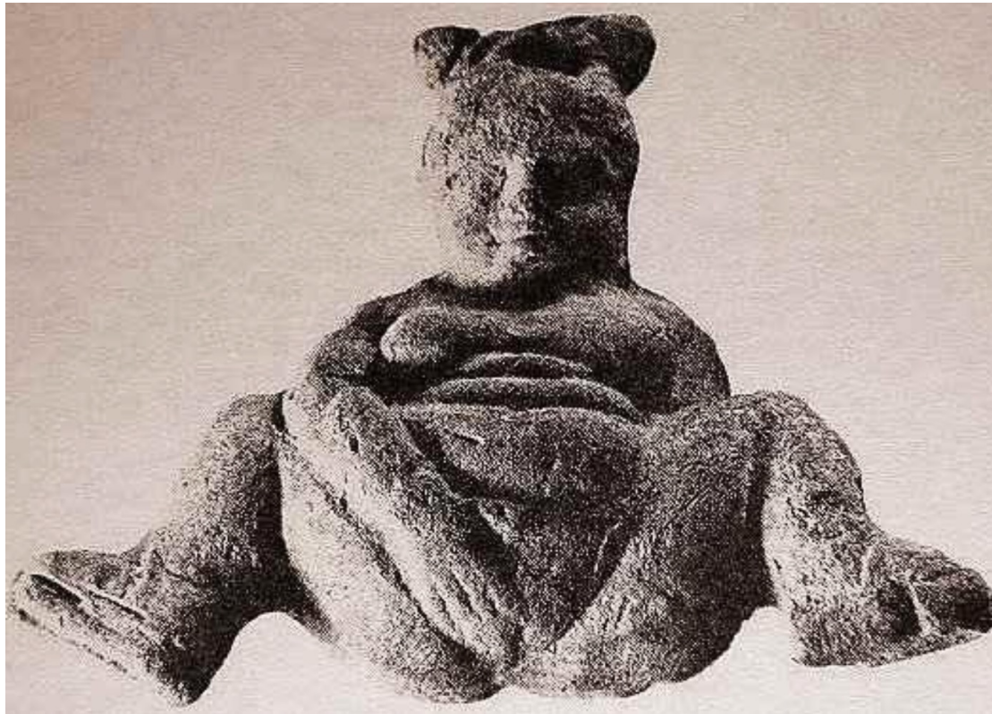
Figurine de Priene - Approx. 300-100 av. J. -C.