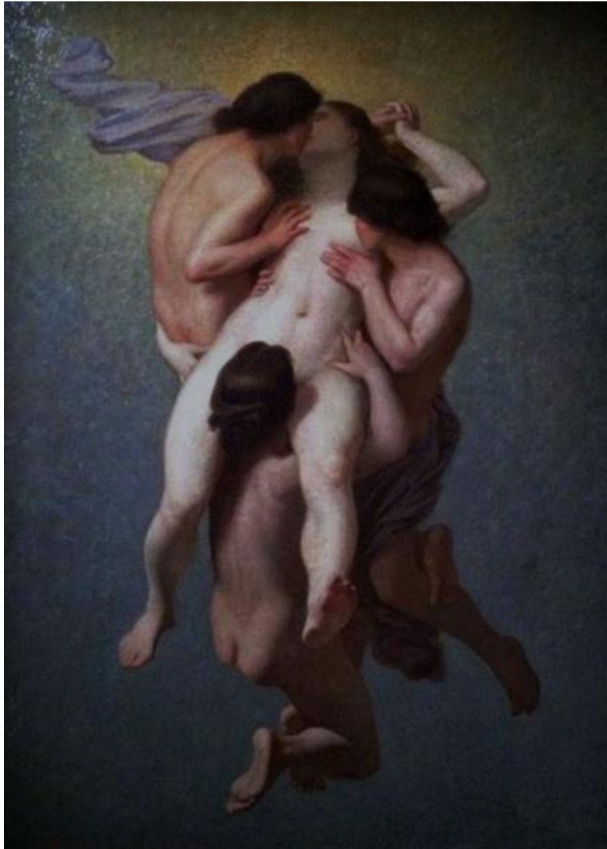
La Femme Damnée de Nicolas Tassaert 1859